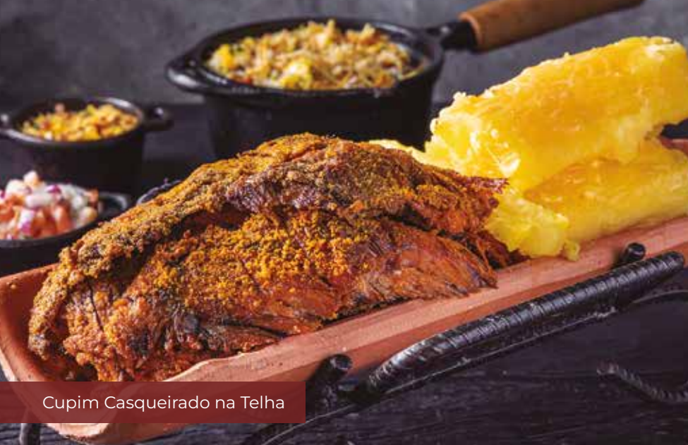
Cupim Casqueirado na Telha