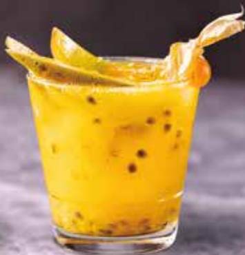
3 Limões • Melancia com maracujá