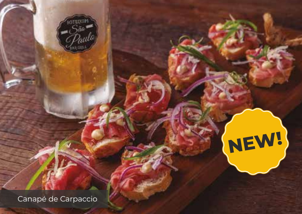
Canapé de Carpaccio