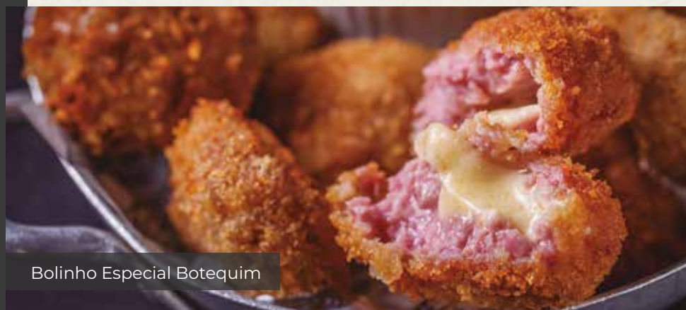
Bolinho Especial Botequim