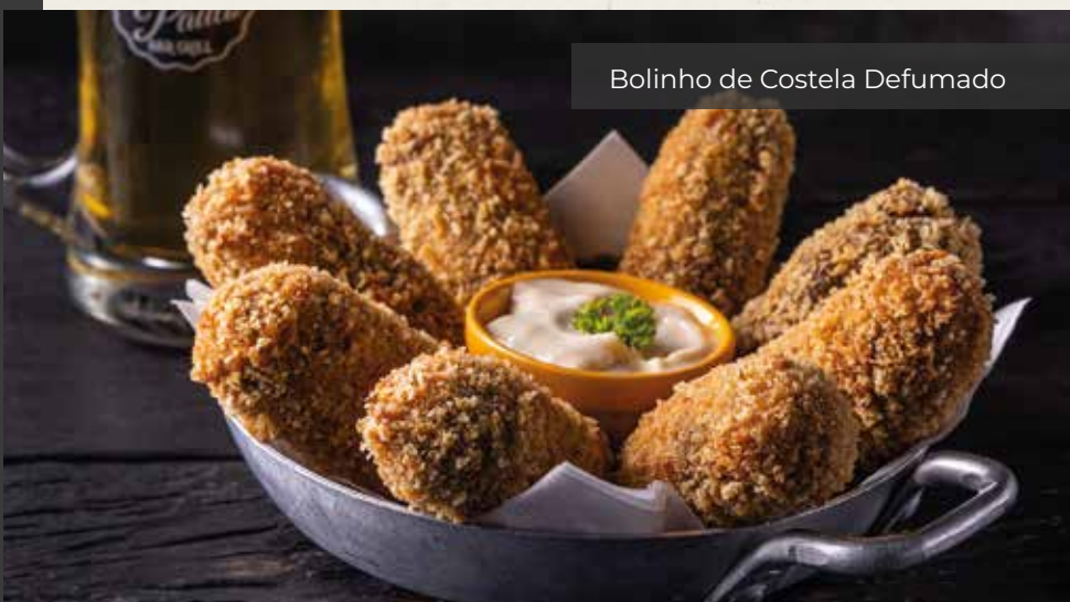
Bolinho de Costela Defumado

500gr de picanha temperada e grelhada. Acompanha pão, vinagrete e farofa.