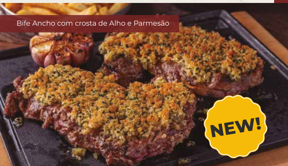
Bife Ancho com crosta de Alho e Parmesão

Bife ancho angus, servido com arroz biro-biro, batata rústica, vinagrete e farofa.