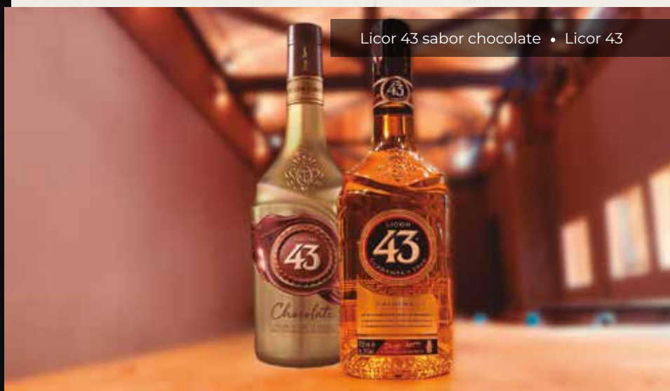
Licor 43 sabor chocolate • Licor 43