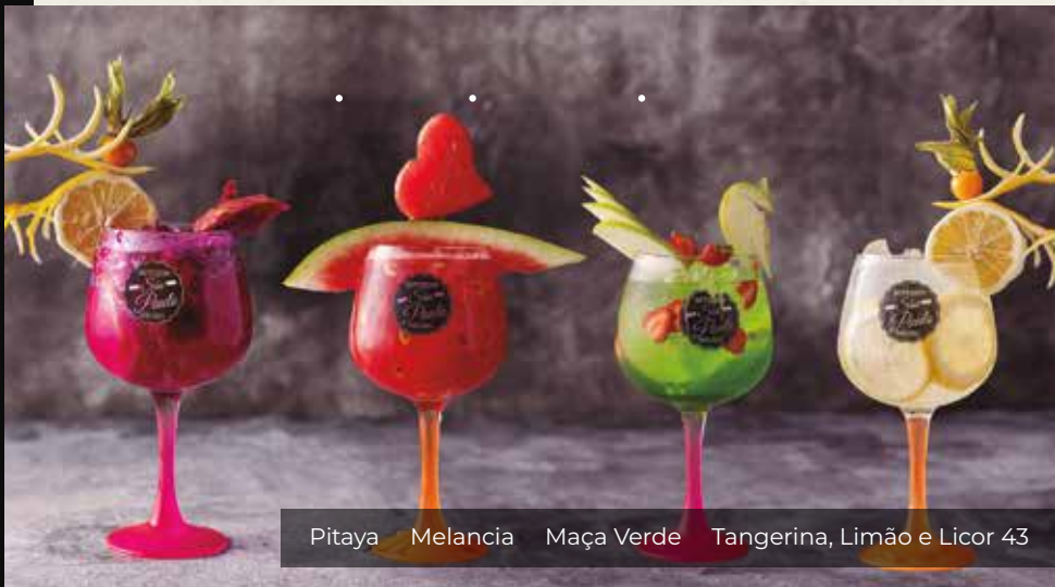
Pitaya • Melancia • Maça Verde • Tangerina, Limão e Licor 43