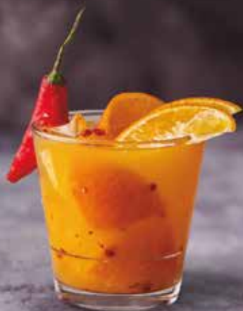
Kiwi com frutas vermelhas • Tangerina com pimenta rosa