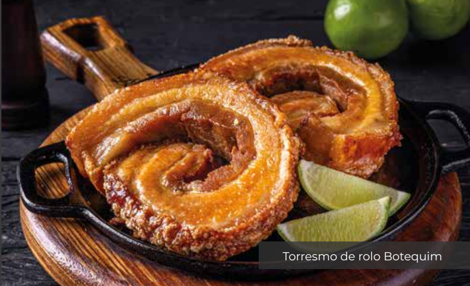
Torresmo de rolo Botequim