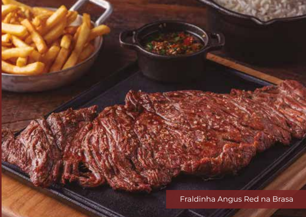
Fraldinha Angus Red na Brasa