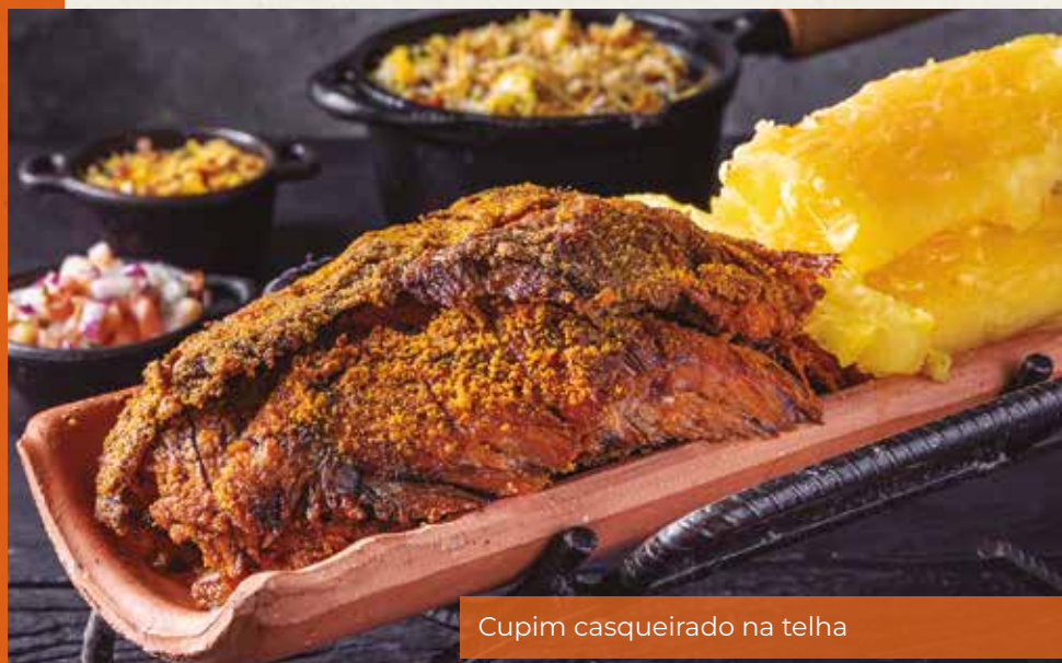
Cupim casqueirado na telha

Acompanha arroz biro-biro, mandioca na manteiga, pão, vinagrete e farofa.