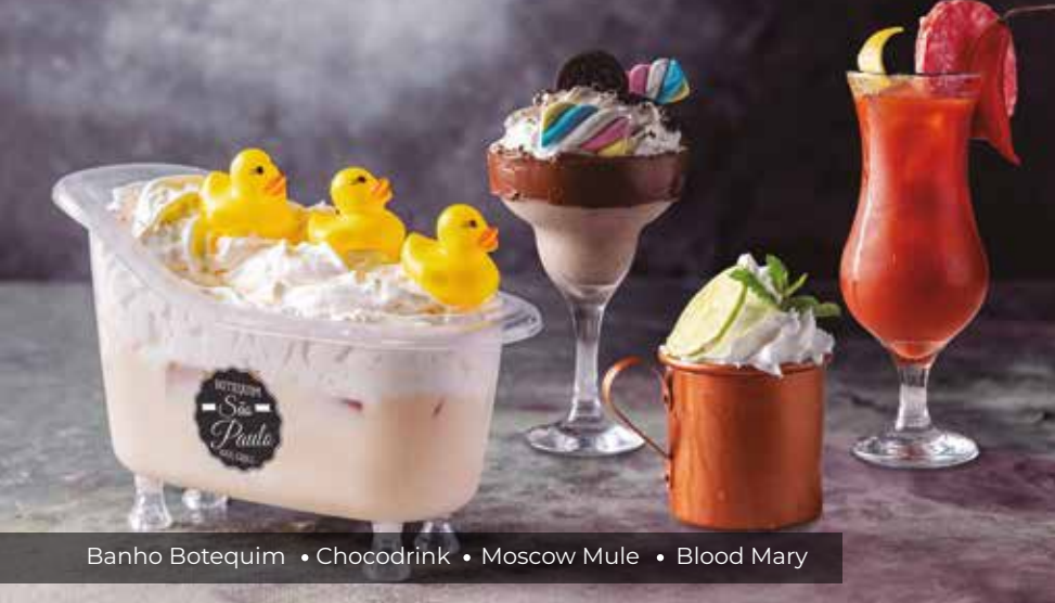
Banho Botequim • Chocodrink • Moscow Mule • Blood Mary