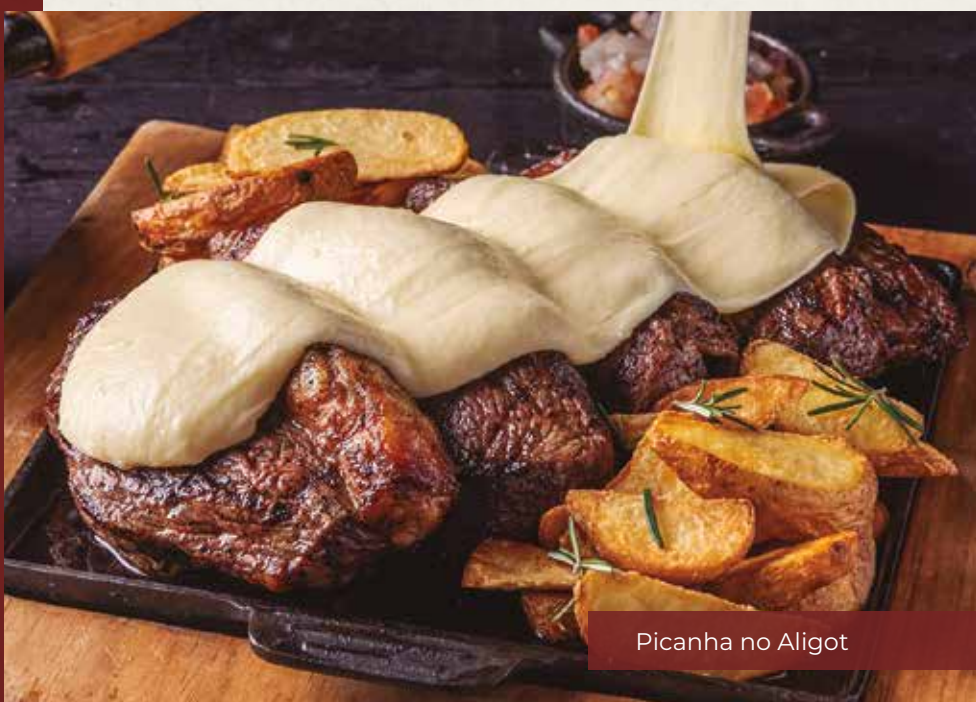
Picanha no Aligot

Acompanha arroz biro-biro, batata rústica, vinagrete e farofa.