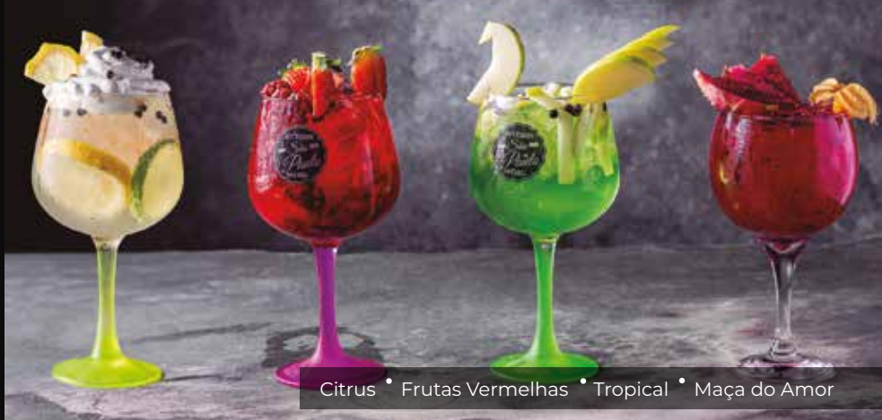
Citrus • Frutas Vermelhas • Tropical • Maça do Amor