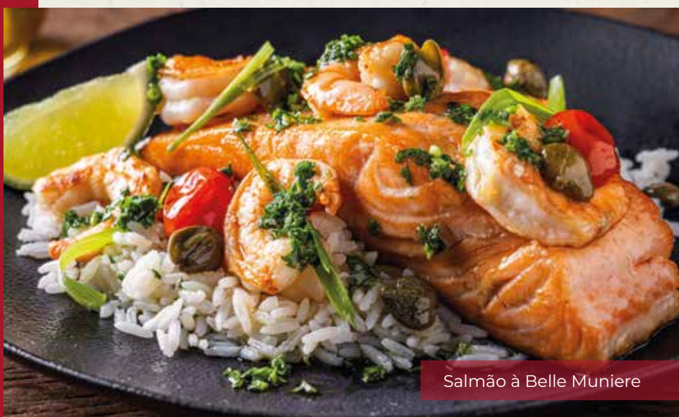
Salmão à Belle Muniere