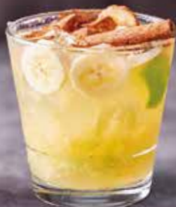
Morango, framboesa e amora • Banana, limão e canela