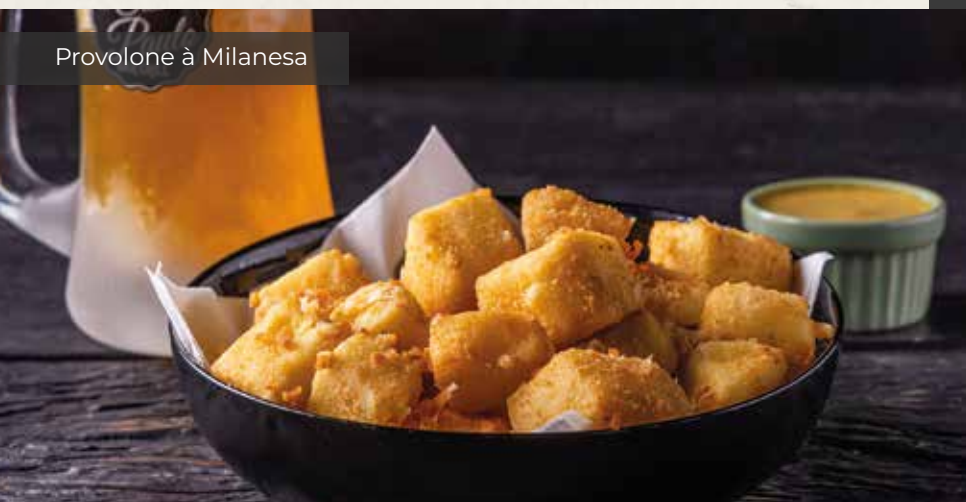
Provolone à Milanese