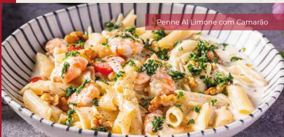
Penne Al Limone com Camarão

Penne com camarões grelhados e tomatinhos regados no nosso molho branco com toque de limão e parmesão.