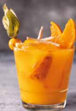
Tangerina com gengibre • Melancia com maracujá